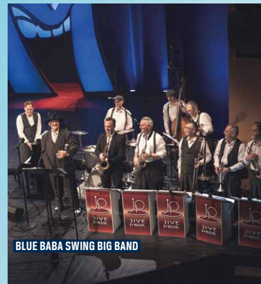
BLUE BABA SWING BIG BAND