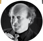
Präsentiert von Arnulf Rating

Tempogeladen und abwechslungsreich komponiert aus Kabarett, Comedy, Musik, Artistik und Poesie u. v. m.: Lokalmatadore, Stars, internationale Künstler